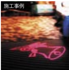
入り口インターロッキング部 (オプション付き)